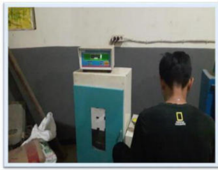
Gambar 1. Mesin Uji Kuat Tekan Beton