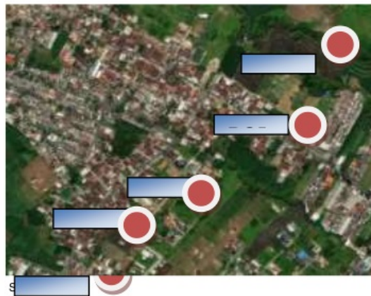
Gambar 1. Point-

Point perencanaan di tentukan berdasarkan hasil FGD dengan masyarakat serta melalui analisa terhadap potensi dan kendala yang ada guna menciptakan kawasan kampung berbasis konservasi sungai.