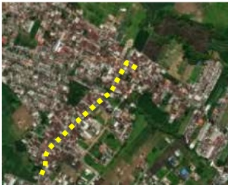
Gambar 5. Jalur penataan koridor pada titik 2