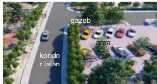
Gambar 7. Peta