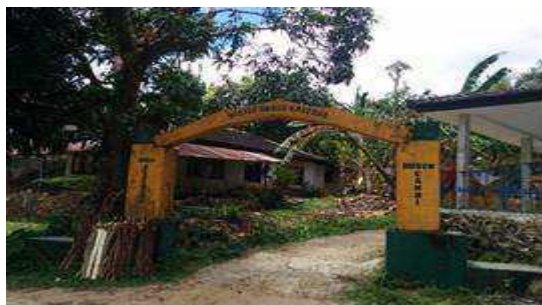
Gambar 4. Gerbang menuju Danau Kastoba, Pulau Bawean, Kabupaten Gresik, Jawa Timur (Hasil Observasi, 2017)