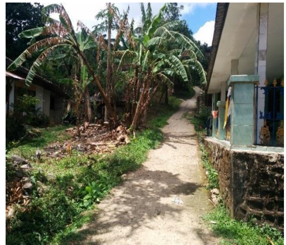
Gambar 3. Jalan Setapak menuju Danau Kastoba, Pulau Bawean, Kabupaten Gresik, Jawa Timur (Hasil Observasi, 2017)

Berdasarkan pengamatan langsung di lapangan menggambarkan bahwa Cagar Alam Danau Kastoba memiliki jalan akses manusia, yang berbatu dan curam, belum tersedianya rambu pengarah menuju lokasi, tidak ada tempat sampah di sekitar danau.