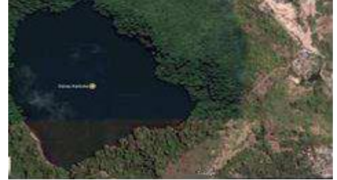
Gambar 2. Lokasi objek wisata Danau Kastoba, Pulau Bawean, Kabupaten Gresik, Jawa Timur (Foto Satelit, 2017)

Adapun salah satu destinasi wisata yang akan dibahas dalam artikel ilmiah ini adalah Danau Kastoba. Kawasan Wisata Danau Kastoba merupakan kawasan cagar budaya sehingga memiliki keanekaragaman vegetasi yang dapat menjadi daya tarik tersendiri. Dengan kedalaman mencapai 140 m dengan lebar 400 m dan panjang 600 m (Trimanto , 2014).