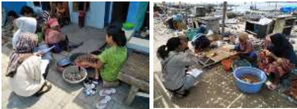
Gambar 2. Kondisi dan Karakteristik Kampung Nelayan Sukolilo Kota Surabaya

Tujuan kegiatan pengabdian masyarakat ini adalah membangun kesadaran masyarakat, motivasi diri, dan keterlibatan secara aktif memperbaiki kualitas hidup melalui upaya upaya menghadapi dampak perubahan iklim dan mitigasi bencana untuk peningkatan akses terhadap modal-modal sustainable livelihood .