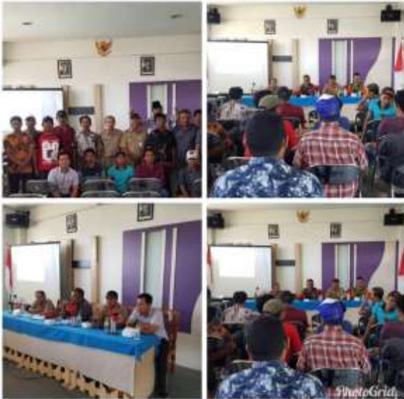
Gambar 5. Workshop Pengembangan Ekonomi Lokal dan Adaptasi Terhadap Perubahan Iklim

Setelah rangkaian kegiatan terlaksana, dilakukan pendampingan dan dilakukan penyebaran angket/kuisisioner di bulan Oktober tahun 2019 untuk mengevaluasi tingkat sustainable livelihood masyarakat. Secara signifikan belum banyak perubahan namun ada peningkatan dan perubahan pada pola pikir dan motivasi diri.