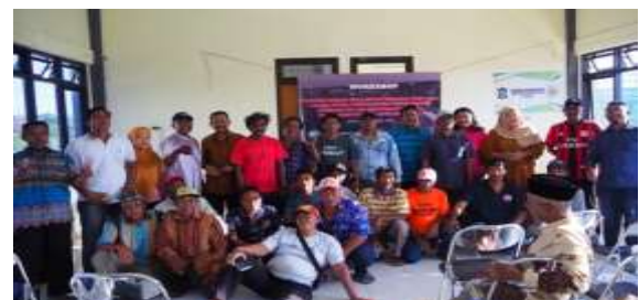
Gambar 4. Focus group discussion