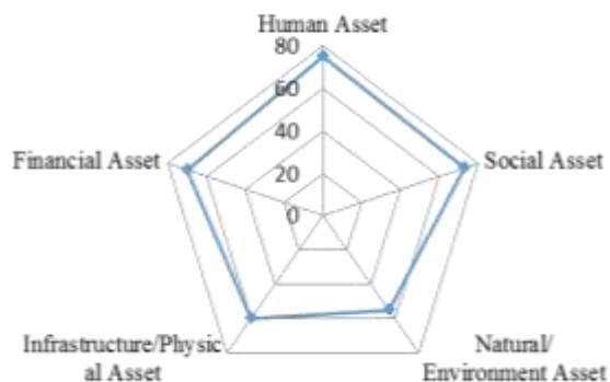
Gambar 5. Perubahan Tingkat Sustainable Livelihood di Kampung Nelayan Sukolilo Pesisir Kota Surabaya Tahun 2019

Setelah rangkaian kegiatan terlaksana, dilakukan pendampingan dan dilakukan penyebaran angket/kuisisioner di bulan Oktober tahun 2019 untuk mengevaluasi tingkat sustainable livelihood masyarakat. Secara signifikan belum banyak perubahan namun ada peningkatan dan perubahan pada pola pikir dan motivasi diri.