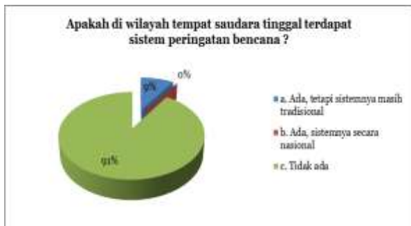
Gambar 3. Hasil Pemetaan Partisipatif terkait Kebencanaan