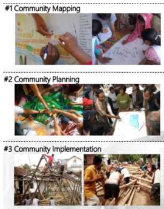
Gambar. 1 Metode Partisipatif Arkom

Inisiasi Paguyuban Kalijawi dan Arkom Yoga tidaklah terbentuk dengan instan. Sejak 2010, Arkom yang merupakan kelompok arsitektur komunitas bekerja untuk memperkuat komunitas permukiman informal di Yogyakarta. Sebagai bagian dari Asian Coalition for Community Action (ACCA) yang diinisiasi oleh Asian Coalition for Housing Right (ACHR), Arkom membantu komunitas masyarakat untuk bisa menemu kenali problem mereka dan mencari solusi bersama. Proses ini berkembang melalui serangkaian proses survey, pemetaan, tabungan bersama, perencanaan, dan workshop yang berupaya menunjukkan realitas bahwa masyarakat informal bukanlah masalah namun bisa bergerak membangun permukiman layak dengan kerjasama komunitas yang solid (ACHR, 2014). Adapun metode yang dilakukan Arkom dan Komunitas adalah melalui serangkaian tahapan partisipatif sebagai berikut Pemetaan Partisipatif, Perencanaan Partisipatif, dan Pelaksanaan Partisipatif.