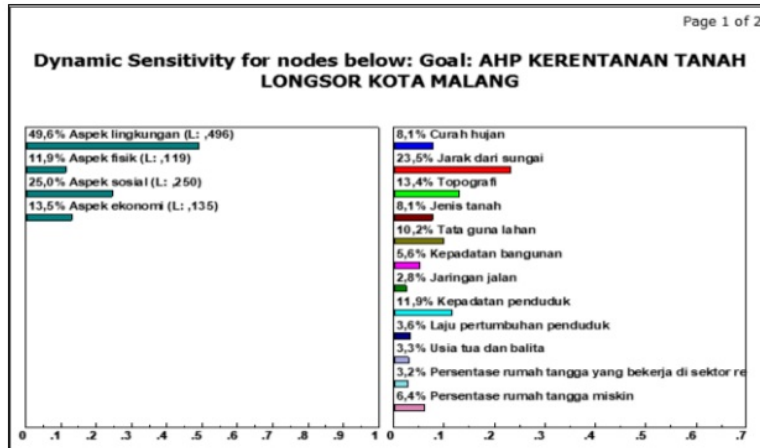
Gambar 2. Hasil Analisis AHP Menggunakan Expert Choice 2000 (sumber: Analisis Peneliti, 2019)

Berdasarkan hasil analisis dengan menggunakan ArcGis 10.5, tingkat kerentanan tanah longsor berdasarkan gerakan tanah di Kota Malang disajikan pada peta gambar 4.3. Dari peta tersebut, didapatkan pola spasial tingkat kerentanan ( vulnerability ) bencana tanah longsor akibat gerakan tanah berdasarkan pengaruh dari aspek lingkungan, aspek fisik, aspek sosial dan aspek ekonomi di Kota Malang. Berdasarkan hasil analisis, Kota Malang berada pada tingkat kerentanan rendah dan sedang.