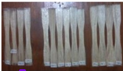
3 Gambar 2. Spesimen Uji Tarik