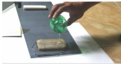
Gambar 3. Spesimen Uji Impact