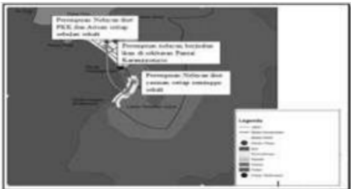
Gambar 2. Pergerakan Perempuan Nelayan sebagai Seorang Kepala Rumah Tangga

Dalam kegiatan yang dilakukan Bu Yatini ini, dia menggunakan beberapa ruang. Ruang-ruang ini digunakan Bu Yatini pada waktu-waktu tertentu. Ruang-ruang ini yang menimbulkan arah pergerakan yang timbul dari satu tempat ke tempat yang lain.