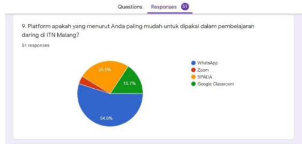
Fig. 9. Grafik jenis platform yang paling mudah

Terkait jenis platform yang paling mudah untuk digunakan dalam pembelajaran daring, sebanyak 55% dari responden yaitu 28 mahasiswa memilih Whatsapp sebagai platform yang paling mudah dimengerti untuk digunakan. Hal ini dapat dimengerti karena dalam whatsapp, mahasiswa dapat langsung berdiskusi dengan dosen dan teman-teman sekelas di sebuah forum chat. Sementara 25,5% yaitu 13 mahasiswa menjawab SPADA lebih mudah untuk digunakan.