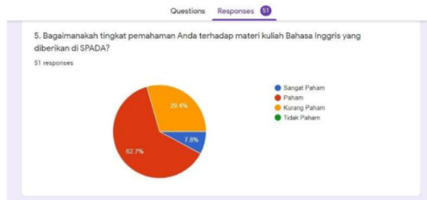
Fig. 6. Grafik tingkat pemahaman

Terkait dengan pertanyaan ke 4 tentang tingkat kesulitan materi yang diberikan oleh dosen, pertanyaan ke 5 melakukan konfirmasi terhadap tingkat pemahaman mahasiswa terhadap materi yang diberikan. Fig. 6. menunjukkan bahwa tingkat pemahaman sesuai dengan mayoritas jawaban yang ditunjukkan pada Fig. 5. Grafik tingkat kesulitan materi. Hanya 29,4% responden yaitu 14 dari 51 mahasiswa yang menyatakan kurang paham terhadap materi. Bahkan tidak ada jawaban “Tidak Paham” dalam respon.