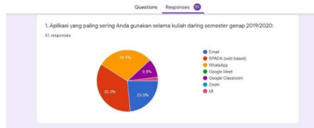
Fig. 2. Grafik tipe aplikasi yang digunakan