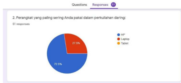
Fig. 3. Grafik jenis perangkat

Pertanyaan ke dua adalah tentang perangkat yang digunakan selama mengikuti pembelajaran daring. 72,5% yaitu 39 mahasiswa dari 51 mahasiswa menggunakan handphone, sisanya yaitu 27,5% menggunakan laptop. Hal ini cukup wajar karena handphone memang lebih mudah dalam mengakses materi pembelajaran maupun informasi kelas terbaru di mana saja dan kapan saja.