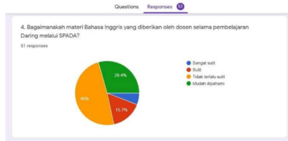
Fig. 5. Grafik tingkat kesulitan materi

Fig. 5. menunjukkan bahwa materi yang diberikan tidak terlalu sulit, bahkan mudah dipahami. Dosen berkomitmen untuk memberikan materi yang lebih disederhanakan dan sesuai untuk pembelajaran daring, sehingga hanya 15,7% yaitu 8 mahasiswa dari 51 yang menyatakan materi sulit.