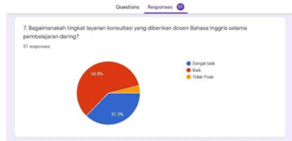
Fig. 7. Grafik layanan dosen selama pembelajaran daring

Selama pembelajaran daring, dosen memiliki peran yang paling penting dalam membimbing mahasiswa untuk memahami materi yang diberikan. Dosen diharapkan memberikan perhatian lebih dari pembelajaran luring, dimana mahasiswa telah bisa berdiskusi dengan dosennya maupun rekan sekelas ketika pembelajaran di kelas berlangsung. Dari hasil responden yang ditunjukkan pada Fig. 7, 97% responden yaitu sebanyak 50 dari 51 mahasiswa menyatakan bahwa layanan konsultasi dosen selama daring ini sudah sangat baik. Dapat disimpulkan bahwa dosen bersedia untuk memberikan layanan bimbingan lebih dari ketika pembelajaran luring.