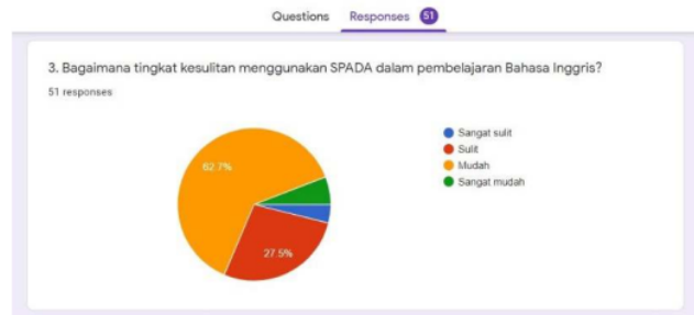
Fig. 4. Grafik tingkat kesulitan mengoperasikan SPADA

Pembelajaran Bahasa Inggris di Teknik Mesin S1 lebih banyak menggunakan SPADA ITN Malang sebagai platform utama untuk membagi materi dan tugas, absensi, juga untuk mengumpulkan tugas. Pertanyaan ke 3 menanyakan tentang tingkat kesulitan dalam mengoperasikan SPADA ITN Malang selama pembelajaran, yang hasilnya disajikan pada Fig. 4.