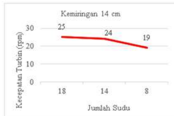
Gambar 4. Grafik jumlah sudu vs kecepatan turbin menggunakan kemiringan 14 cm tanpa beban.

Dapat disimpulkan bahwa dengan perbandingan jumlah sudu 18,14 dan 8 dengan tinggi bagian depan 110 cm dan bagian belakang tinggi 96 cm dengan beda ketinggian sebesar 14 cm didapat kecepatan turbin sebesar 25 rpm menggunakan jumlah sudu 18 buah, untuk jumlah sudu 14 didapat putaran sudu sebesar 24 rpm dan untuk jumlah sudu 8 didapat 19 rpm. Dari grafik 4 diatas nilai rata-rata yang didapat dari kecepatan turbin dengan material aluminium dengan jumlah sudu 18, 14 dan 8. Dapat disimpulkan bahwa semakin sedikit jumlah sudu putaran turbin semakin kecil dan semakin banyak jumlah sudu pada turbin maka putaran turbin semakin kencang dan nilai efisiensi dari turbin yang di dapat semakin besar, karena sudu sangat berpengaruh terhadap efisiensi kincir air tipe undershot terutama pada penelitian ini menggunakan material sudu aluminium.