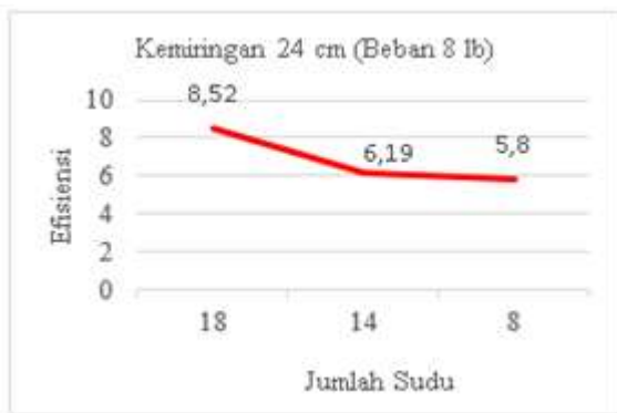
Gambar 5. Grafik efisiensi dengan jumlah sudu 18, 14 dan 8 menggunakan kemiringan 24 cm dengan beban 8 lb.

Maka dapat diambil kesimpulan bahwa dengan perbandingan jumlah sudu 18,14 dan 8 dengan tinggi bagian depan 110 cm dan bagian belakang tinggi 86 cm dengan beda ketinggian sebesar 24 cm didapat efisiensi sebesar 8,52% menggunakan jumlah sudu 18 buah, untuk jumlah sudu 14 didapat 6,19% dan untuk jumlah sudu 8 didapat 5,80%. Dari grafik 5 diatas nilai rata-rata yang didapatkan dari efisiensi dengan material sudu aluminium dengan jumlah sudu 18, 14 dan 8. Dapat disimpulkan semakin sedikit jumlah sudu putaran turbin semakin kecil dan semakin banyak jumlah sudu pada turbin maka putaran turbin semakin kencang dan nilai efisiensi dari turbin yang di dapat semakin besar, karena sudu sangat berpengaruh terhadap efisiensi kincir air tipe undershot terutama pada penelitian ini menggunakan material sudu aluminium.