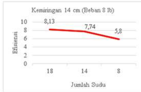
Gambar 6. Grafik efisiensi dengan jumlah sudu 18, 14 dan 8 menggunakan kemiringan 14 cm dengan beban 8 lb.

Maka dapat diambil kesimpulan bahwa dengan perbandingan jumlah sudu 18,14 dan 8 dengan tinggi bagian depan 110 cm dan bagian belakang tinggi 96 cm dengan beda ketinggian sebesar 14 cm didapat efisiensi sebesar 8,13% menggunakan jumlah sudu 18 buah, untuk jumlah sudu 14 didapat 7,74% dan untuk jumlah sudu 8 didapat 5,80%. Dari grafik 6 diatas nilai rata-rata yang didapatkan dari efisiensi dengan material sudu aluminium dengan jumlah sudu 18, 14 dan 8. Dapat disimpulkan bahwa semakin sedikit jumlah sudu putaran turbin semakin kecil dan semakin banyak jumlah sudu pada turbin maka putaran turbin semakin kencang dan nilai efisiensi dari turbin yang di dapat semakin besar, karena sudu sangat berpengaruh terhadap efisiensi kincir air tipe undershot terutama pada penelitian ini menggunakan material sudu aluminium.