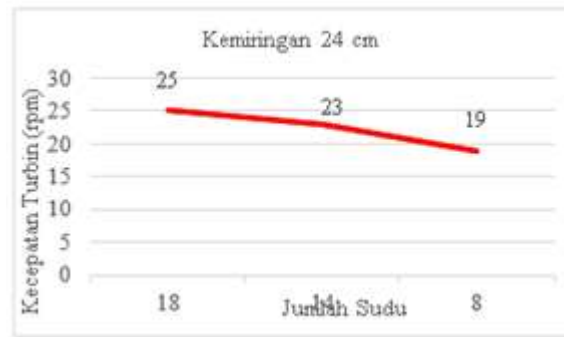
Gambar 2. Grafik jumlah sudu vs kecepatan turbin menggunakan kemiringan 24 cm tanpa beban.

Dapat disimpulkan bahwa dengan perbandingan jumlah sudu 18,14 dan 8 dengan tinggi bagian depan 110 cm dan bagian belakang tinggi 86 cm dengan beda ketinggian sebesar 24 cm didapat kecepatan turbin sebesar 25 rpm menggunakan jumlah sudu 18 buah, untuk jumlah sudu 14 didapat putaran sudu sebesar 23 rpm dan untuk jumlah sudu 8 didapat 19 rpm. Dari grafik 2 diatas nilai rata-rata yang didapat dari kecepatan turbin dengan material aluminium dengan jumlah sudu 18, 14 dan 8. Dapat disimpulkan bahwa semakin sedikit jumlah sudu putaran turbin semakin kecil dan semakin banyak jumlah sudu pada turbin maka putaran turbin semakin kencang dan nilai efisiensi dari turbin yang di dapat semakin besar, karena sudu sangat berpengaruh terhadap efisiensi kincir air tipe undershot terutama pada penelitian ini menggunakan material sudu aluminium.