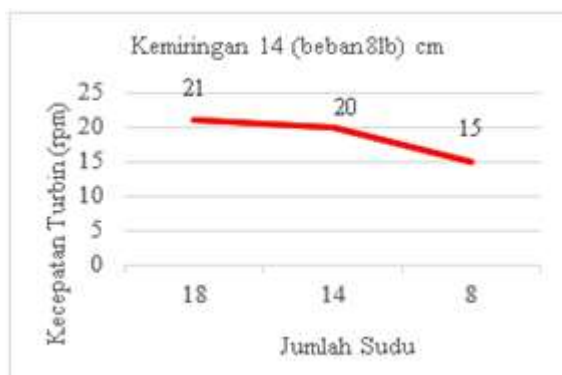
Gambar 3. Grafik jumlah sudu vs kecepatan turbin menggunakan kemiringan 14 cm dengan beban 8 lb.

Dapat disimpulkan bahwa dengan perbandingan jumlah sudu 18,14 dan 8 dengan tinggi bagian depan 110 cm dan bagian belakang tinggi 96 cm dengan beda ketinggian sebesar 14 cm didapat kecepatan turbin sebesar 21 rpm menggunakan jumlah sudu 18 buah, untuk jumlah sudu 14 didapat putaran sudu sebesar 20 rpm dan untuk jumlah sudu 8 didapat 15 rpm. Dari grafik 3 diatas nilai rata-rata yang didapat dari kecepatan turbin dengan material aluminium dengan jumlah sudu 18, 14 dan 8. Dapat disimpulkan bahwa semakin sedikit jumlah sudu putaran turbin semakin kecil dan semakin banyak jumlah sudu pada turbin maka putaran turbin semakin kencang dan nilai efisiensi dari turbin yang di dapat semakin besar, karena sudu sangat berpengaruh terhadap efisiensi kincir air tipe undershot terutama pada penelitian ini menggunakan material sudu aluminium.