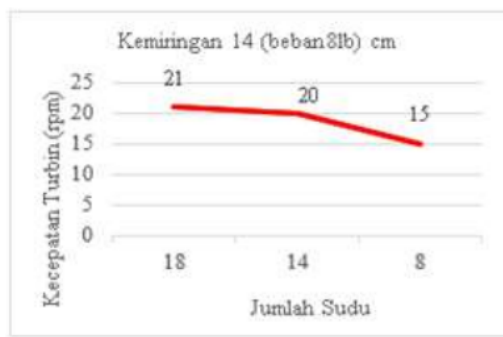
Gambar 3. Grafik jumlah sudu vs kecepatan turbin menggunakan kemiringan 14 cm dengan beban 8 lb.

Dapat disimpulkan bahwa dengan perbandingan jumlah sudu 18,14 dan 8 dengan tinggi bagian depan 110 cm dan bagian belakang tinggi 96 cm dengan beda ketinggian sebesar 14 cm didapat kecepatan turbin sebesar 21 rpm menggunakan jumlah sudu 18 buah, untuk jumlah sudu 14 didapat putaran sudu sebesar 20 rpm dan untuk jumlah sudu 8 didapat 15 rpm. Dari grafik 3 diatas nilai rata-rata yang didapat dari kecepatan turbin dengan material aluminium dengan jumlah sudu 18, 14 dan 8. Dapat disimpulkan bahwa semakin sedikit jumlah sudu putaran turbin semakin kecil dan semakin banyak jumlah sudu pada turbin maka putaran turbin semakin kencang dan nilai efisiensi dari turbin yang di dapat semakin besar, karena sudu sangat berpengaruh terhadap efisiensi kincir air tipe undershot terutama pada penelitian ini menggunakan material sudu aluminium.