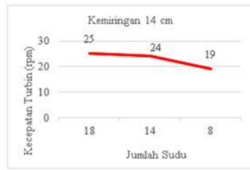
Gambar 4. Grafik jumlah sudu vs kecepatan turbin menggunakan kemiringan 14 cm tanpa beban.

Dapat disimpulkan bahwa dengan perbandingan jumlah sudu 18,14 dan 8 dengan tinggi bagian depan 110 cm dan bagian belakang tinggi 96 cm dengan beda ketinggian sebesar 14 cm didapat kecepatan turbin sebesar 25 rpm menggunakan jumlah sudu 18 buah, untuk jumlah sudu 14 didapat putaran sudu sebesar 24 rpm dan untuk jumlah sudu 8 didapat 19 rpm. Dari grafik 4 diatas nilai rata-rata yang didapat dari kecepatan turbin dengan material aluminium dengan jumlah sudu 18, 14 dan 8. Dapat disimpulkan bahwa semakin sedikit jumlah sudu putaran turbin semakin kecil dan semakin banyak jumlah sudu pada turbin maka putaran turbin semakin kencang dan nilai efisiensi dari turbin yang di dapat semakin besar, karena sudu sangat berpengaruh terhadap efisiensi kincir air tipe undershot terutama pada penelitian ini menggunakan material sudu aluminium.