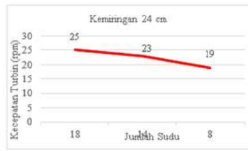
Gambar 2. Grafik jumlah sudu vs kecepatan turbin menggunakan kemiringan 24 cm tanpa beban.

Dapat disimpulkan bahwa dengan perbandingan jumlah sudu 18,14 dan 8 dengan tinggi bagian depan 110 cm dan bagian belakang tinggi 86 cm dengan beda ketinggian sebesar 24 cm didapat kecepatan turbin sebesar 25 rpm menggunakan jumlah sudu 18 buah, untuk jumlah sudu 14 didapat putaran sudu sebesar 23 rpm dan untuk jumlah sudu 8 didapat 19 rpm. Dari grafik 2 diatas nilai rata-rata yang didapat dari kecepatan turbin dengan material aluminium dengan jumlah sudu 18, 14 dan 8. Dapat disimpulkan bahwa semakin sedikit jumlah sudu putaran turbin semakin kecil dan semakin banyak jumlah sudu pada turbin maka putaran turbin semakin kencang dan nilai efisiensi dari turbin yang di dapat semakin besar, karena sudu sangat berpengaruh terhadap efisiensi kincir air tipe undershot terutama pada penelitian ini menggunakan material sudu aluminium.