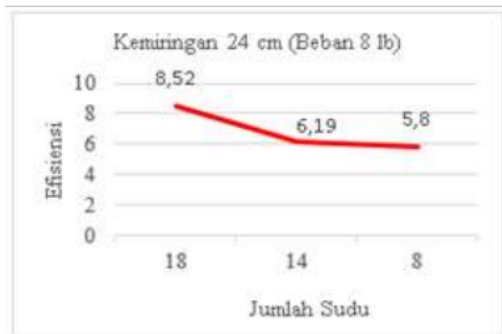
Gambar 5. Grafik efisiensi dengan jumlah sudu 18, 14 dan 8 menggunakan kemiringan 24 cm dengan beban 8 lb.

Maka dapat diambil kesimpulan bahwa dengan perbandingan jumlah sudu 18,14 dan 8 dengan tinggi bagian depan 110 cm dan bagian belakang tinggi 86 cm dengan beda ketinggian sebesar 24 cm didapat efisiensi sebesar 8,52% menggunakan jumlah sudu 18 buah, untuk jumlah sudu 14 didapat 6,19% dan untuk jumlah sudu 8 didapat 5,80%. Dari grafik 5 diatas nilai rata-rata yang didapatkan dari efisiensi dengan material sudu aluminium dengan jumlah sudu 18, 14 dan 8. Dapat disimpulkan semakin sedikit jumlah sudu putaran turbin semakin kecil dan semakin banyak jumlah sudu pada turbin maka putaran turbin semakin kencang dan nilai efisiensi dari turbin yang di dapat semakin besar, karena sudu sangat berpengaruh terhadap efisiensi kincir air tipe undershot terutama pada penelitian ini menggunakan material sudu aluminium.