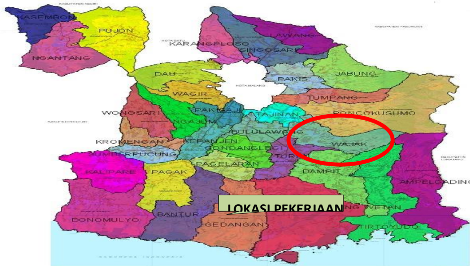
Gambar 1 Peta Adiministrasi Kecamatan Waiak