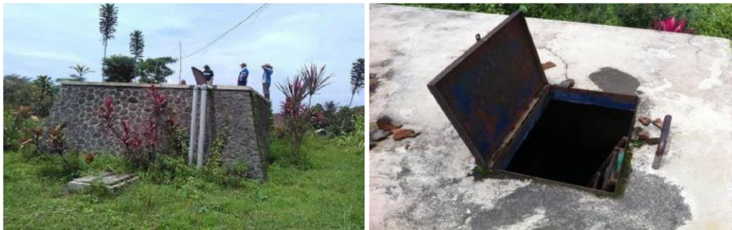
Gambar 2. Tandon Air Eksisting Desa Bambang

Pada lokasi perencanaan distribusi air bersih di Desa Bambang kondisi di wilayah tersebut sebelum ada jaringan perpipaan masyarakatnya masih mengandalkan air bersih dari sumur bor yang meskipun jumlahnya terbatas karena tidak semua masyarakat di Desa Bambang mempunyai sumur bor. Beberapa masyarakat yang tidak memiliki sumur bor masih mengandalkan air bersih dari sumber air yaitu melalui pipa – pipa kecil yang dibuat sukarela oleh masyarakat dari sumber air yang kemudian air tersebut ditampung di dalam tandon serta dalam pendistribusiannya langsung dari tandon. Berikut ini gambar tandon eksisting yang di buat sukarela oleh masyarakat :