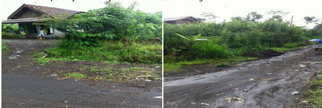
Gambar 3. Akses Menuju Lokasi Sumber Air

Selain itu juga wilayah Desa Bambang Kecamatan Wajak belum terlayani oleh pelayanan PDAM (Perusahaan Daerah Air Minum) dikarenakan kontur wilayahnya yg berbukit – bukit, wilayah yang sulit dijangkau, dan jalan atau medan yang masih tanah belum beraspal yang menyebabkan sulitnya air dari PDAM (Perusahaan Daerah Air Minum) tidak bisa masuk ke wilayah tersebut. Berikut ini merupakan jalan menuju sumber air Desa Bambang :