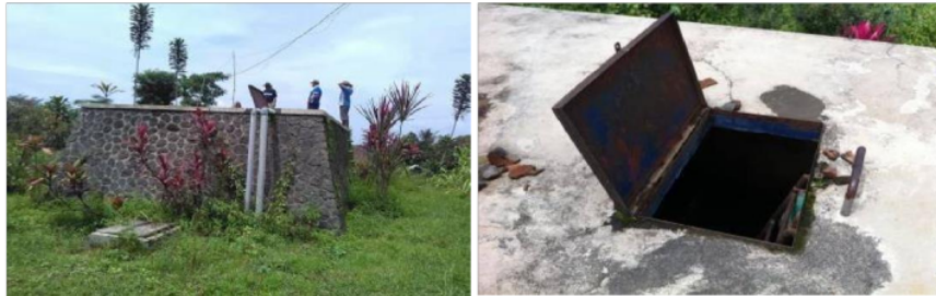
Gambar 2. Tandon Air Eksisting Desa Bambang

Pada lokasi perencanaan distribusi air bersih di Desa Bambang kondisi di wilayah tersebut sebelum ada jaringan perpipaan masyarakatnya masih mengandalkan air bersih dari sumur bor yang meskipun jumlahnya terbatas karena tidak semua masyarakat di Desa Bambang mempunyai sumur bor. Beberapa masyarakat yang tidak memiliki sumur bor masih mengandalkan air bersih dari sumber air yaitu melalui pipa – pipa kecil yang dibuat sukarela oleh masyarakat dari sumber air yang kemudian air tersebut ditampung di dalam tandon serta dalam pendistribusiannya langsung dari tandon. Berikut ini gambar tandon eksisting yang di buat sukarela oleh masyarakat :