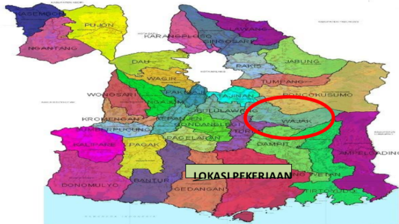
Gambar 1 Peta Adiministrasi Kecamatan Wajak