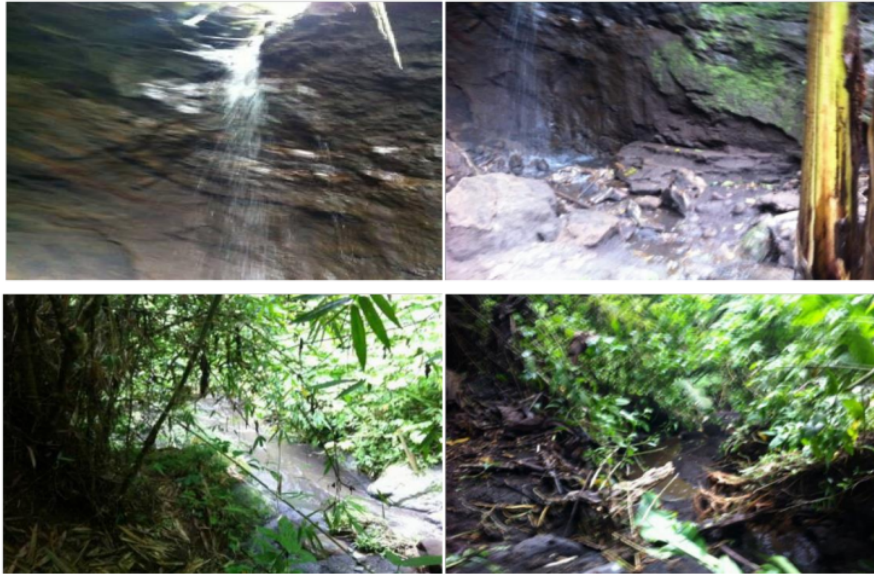
Gambar 4 Sumber Air Desa Bambang

Berdasarkan kondisi eksisting di Desa Bambang Kec. Wajak dimana air bersih masih sangat terbatas karena kurangnya memaksimalkan potensi sumber air yang ada. Apalagi jika dilihat di lapangan potensi sumber air di Desa Bambang sangat baik secara kualitas air dan debit airnya yang mencapai 5 lt/dtk sehingga dari debit air tersebut masih memungkinkan untuk dikembangkan secara maksimal dan optimal.