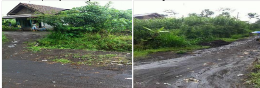
Gambar 3. Akses Menuju Lokasi Sumber Air Sumber

Selain itu juga wilayah Desa Bambang Kecamatan Wajak belum terlayani oleh pelayanan PDAM (Perusahaan Daerah Air Minum) dikarenakan kontur wilayahnya yg berbukit – bukit, wilayah yang sulit dijangkau, dan jalan atau medan yang masih tanah belum beraspal yang menyebabkan sulitnya air dari PDAM (Perusahaan Daerah Air Minum) tidak bisa masuk ke wilayah tersebut. Berikut ini merupakan jalan menuju sumber air Desa Bambang :