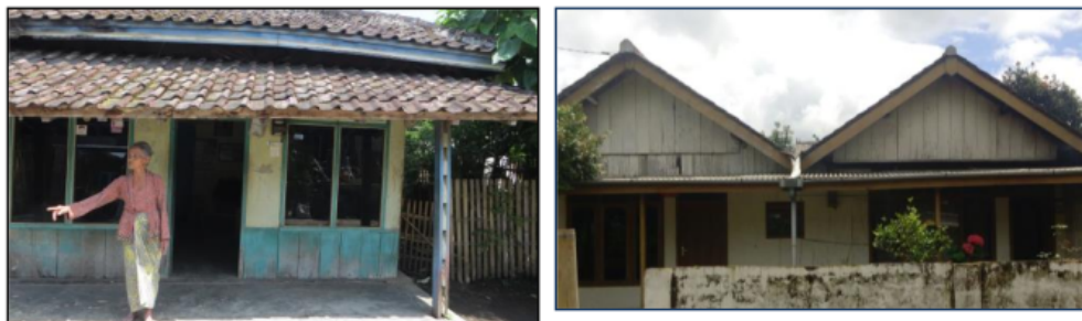
Gambar 10 Bangunan Hunian Tipe Semi Terbuka Semi-Permanen