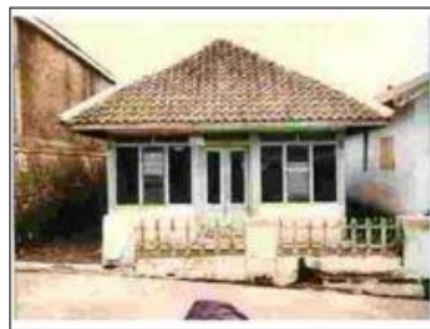
Gambar 4 Tipe Terbuka