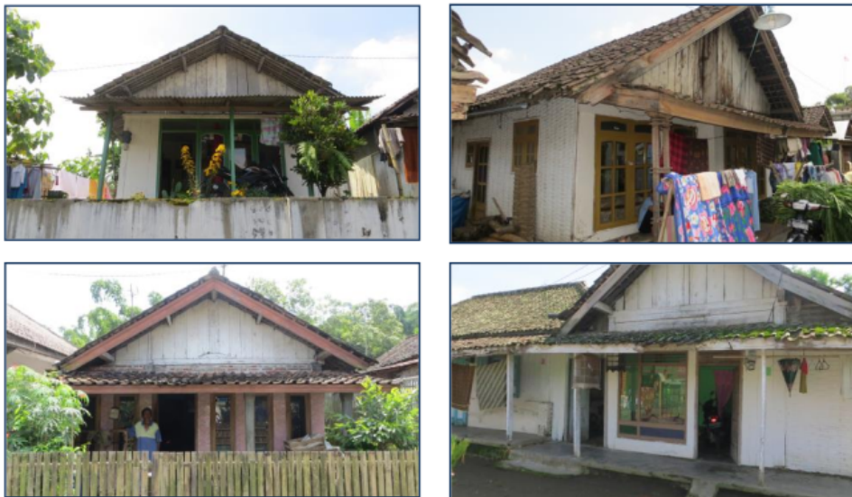
Gambar 8 Bangunan Hunian Tipe Semi Terbuka-Non Permanen

Bangunan hunian tipe semi terbuka-non permanen memiliki karakter struktur atas (atap) menggunakan konstruksi atap pelana dengan bahan penutup atap terdiri dari genteng tanah liat di bagian atap dan tatanan papan kayu di bagian depan dan belakang atap. Struktur tengah bangunan (main structure) menggunakan konstruksi kayu untuk kolom dan penutup dinding dari tatanan papan kayu. Bukaan utama berada di bagian depan rumah yang terdiri dari pintu kayu dan jendela dengan penutup kaca yang berukuran selebar dinding depan rumah. Sedangkan di bagian samping rumah minim bukaan, jika ada hanya berupa pintu tambahan saja yang digunakan sebagai akses keluar masuk penghuni rumah dan tertangga terdekat yang sebagian besar memiliki hubungan kekerabatan. Berpijak pada kajian teoritik terdahulu yang telah dilakukan peneliti, bangunan hunian tipe ini disebut bangunan semi terbuka-non permanen. Bangunan tipe ini merupakan tipe bangunan dengan prosentase terbanyak di wilayah Desa Pandansari, Kecamatan Poncokusumo, Kabupaten Malang, dengan luasan bangunan bervariasi mulai dari luasan kecil sampai dengan luasan besar.