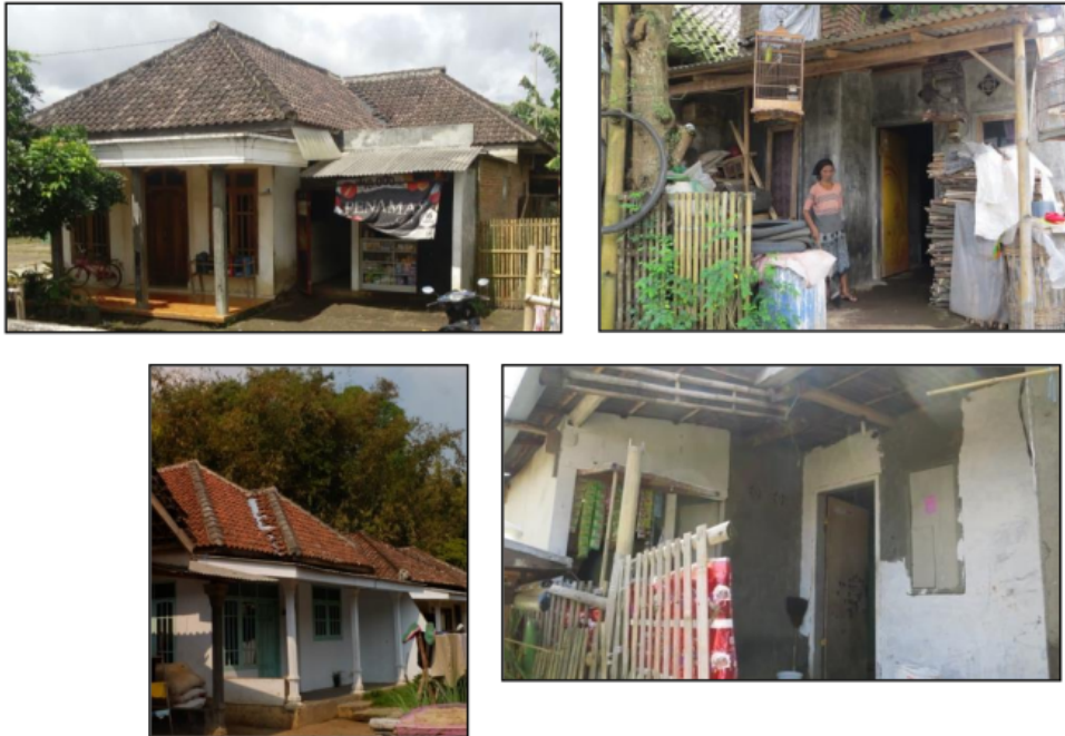
Gambar 11 Bangunan Hunian Tipe Terbuka-Permanen

juga pada bagian samping rumah. Model bangunan dalam hal ini tidak menjadi acuan bagi penentuan tipologi hunian.