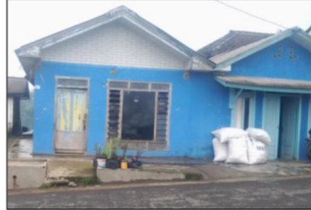
Gambar 2. Tipe Banqunan Baru ('Moderen')