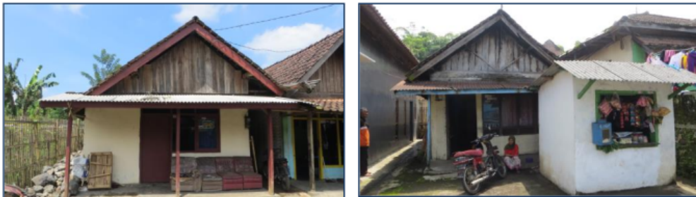
Gambar 9 Bangunan Hunian Tipe Semi Terbuka Semi-Permanen

Bangunan hunian tipe 2 memiliki ciri bangunan yang dengan kondisi bukaan yang hanya berada di bagian depan bangunan dengan penggunaan material bangunan gabungan antara material permanen (misalnya dinding dari batu bata) dan material non permanen (misalnya dinding dari tatanan papan kayu). Bangunan tipe ini sebagian besar masih memanfaatkan tatanan papan kayu pada sebagian fisik bangunannya, seperti terlihat pada contoh foto dokumentasi peneliti yang menggunakan tatanan papan kayu sebagai penutup atap atau sebagai penutup dinding.