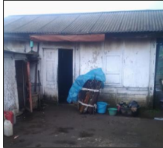
Gambar 1. Tipe Bangunan Lama (Asli)

Tipologi bangunan hunian di kawasan Desa Ngadas Tengger dapat dikelompokkan berdasarkan geometri dan materialnya (Sukowiyono : 2011, 2017). Berdasarkan bentuk geometrinya, hunian masyarakat di kawasan Desa Ngadas, Tengger dapat dibagi menjadi dua yaitu bangunan yang masih kelihatan lama (asli) dan bangunan baru ('moderen').