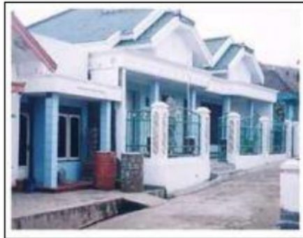
Gambar 5 Tipe 'Moderen'