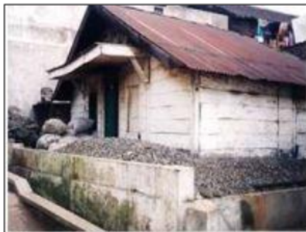
Gambar 3. Tipe Tertutup

Sedangkan berdasarkan material bangunan yang digunakan, tipologi bangunan dapat dikelompokkan menjadi tiga jenis, yaitu tipe tertutup, tipe terbuka, dan tipe modern (Sukowiyono : 2011, 2017). Tipe tertutup adalah kelompok bangunan hunian yang hanya memiliki pintu sebagai bukaan, dengan dinding yang terbuat dari salah satu jenis material non permanen yaitu pasangan papan kayu atau anyaman bambu. Tipe terbuka adalah kelompok bangunan hunian yang sudah memiliki bukaan dalam bentuk pintu dan jendela kaca, serta menggunakan dinding dari kombinasi bahan permanen dan semi permanen yaitu pasangan batu bata dan papan kayu. Sedangkan tipe bangunan 'moderen' adalah kelompok bangunan hunian yang sudah menggunakan bahan material permanen secara menyeluruh.