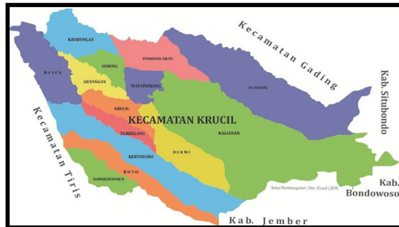
Gambar 1. Lokasi penelitian berada di Ruas Jalan Krucil- Tambelang (R.53) di Kabupaten Probolinggo

Metode penelitian ini dilakukan dengan melakukan: