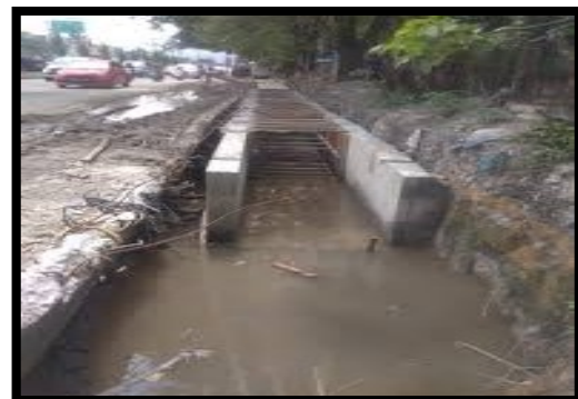
Gambar2. Kondisi eksisting Ruas Jalan Krucil- Tambelang (R.53)