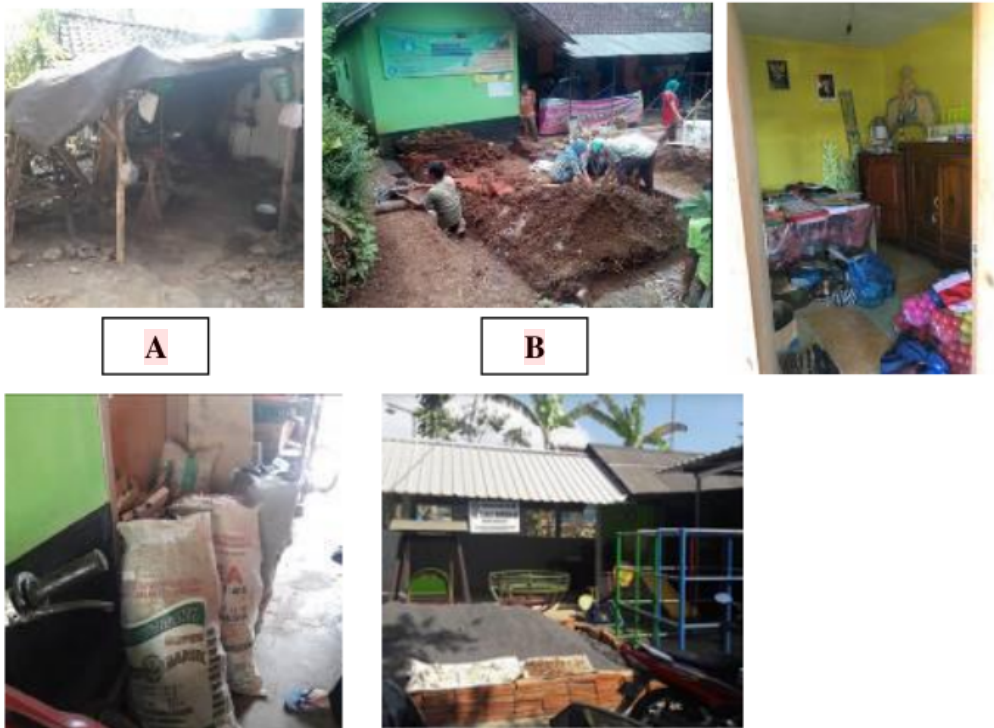
Gambar 2. Karakteristik Fisik Spasial PAUD Tunas Bangsa 2

Dari pengamatan awal ini peneliti pada studi awal ini dapat mengambil berbagai poin amatan yang terkait dengan karakteristik fisik spasial antara lain: