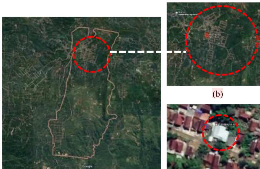
Gambar. 1 DATA DISPLAY: ANALISIS SITUASI

Analisa situasi adalah analisa pada studi kasus yang dilakukan baik pada proses survei awal maupun survei utama dimana analisa ini bertujuan untuk mendapatkan gambaran kondisi real pada studi kasus. Kondisi ini dapat berupa potensi, kendala, masalah, kelebihan dan kekurangan studi kasus yang ada pada lokasi dimana hasil analisa ini dapat digunakan sebagai acuan untuk merumuskan data awal pada penelitian. Jenis analisa situasi ini juga bisa digolongkan kedalam proses Preliminary Survey, karena analisis ini masih bersifat memberikan gambaran studi kasus di awal penelitian. Analisis situasi merupakan analisis yang menggambarkan keadaan studi kasus. Analisis situasi dibagi kedalam 3 jenis data antara lain: