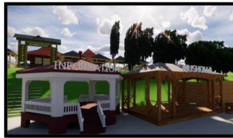
Gambar 4. Desain Bagian Informasi dan Mushola