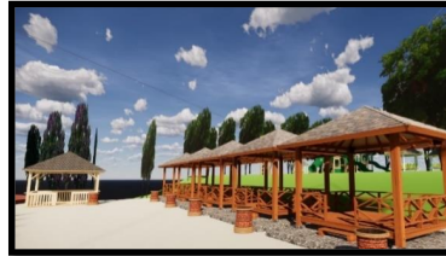
Gambar 3 Desain Pendopo dan Tempat Penyewaan Alat Renang

Jenon. Jadi ditambahkan pendopo pada sisi bagian kanan dan kursi santai di sekitar kolam. Selain itu pada ujung sisi kiri terdapat tempat penyewaan alat-alat renang seperti ban, pelampung dan alat selam