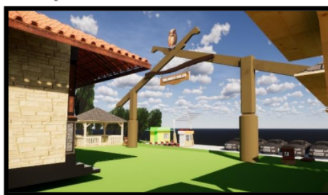
Gambar 8 Desain Gerbang Keluar Kawasan Sumber Air Jenon

Gerbang keluar dari pusat oleh-oleh dibuat langsung menuju ke parkir agar memudahkan pengunjung. Selain itu melihat kondisi eksisting lokasi parkir yang ada di Sumber Jenon yang cukup luas memungkinkan dapat menampung cukup banyak kendaraan roda dua dan kendaraan roda empat.