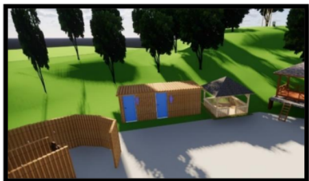
Gambar 5 Desain Kamar Mandi Umum