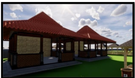
Gambar 7 Desain Pusat oleh-oleh

Penambahan pusat oleh-oleh Sumber Jenon ini diperuntukan untuk masyarakat Desa Gunungronggo dikarenakan masyarakat Desa Gunungronggo bisa menjual produk olahan khas yang bisa membantu perekonomian masyarakat. Selain itu di kawasan pusat oleh-oleh ini juga terdapat pendopo yang dapat digunakan apabila para pengunjung ingin istirahat setelah berbelanja. Pusat oleh-oleh ini dibuat menuju arah gerbang keluar sehingga apabila pengunjung ingin pulang pasti akan melewati pusat oleh-oleh ini.