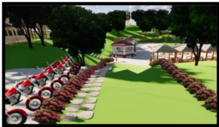
Gambar 2. Desain Gerbang Masuk Sumber Jenon

Sumber Jenon memang memiliki pintu masuk lalu perlu ditambahkan beberapa tanaman bunga disepanjang jalan menuju kolam. Dikarenakan jalan dari loket tiket menuju kolam agak curam sehingga dibagian sisi kanan ditambahkan anak tangga agar memudahkan pengunjung, tetapi dibagian sisi kiri tidak diubah dikarenakan mengantisipasi ada pengunjung yang membawa kereta bayi.