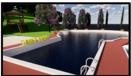
Gambar 6 Desain Kolam Sumber Air