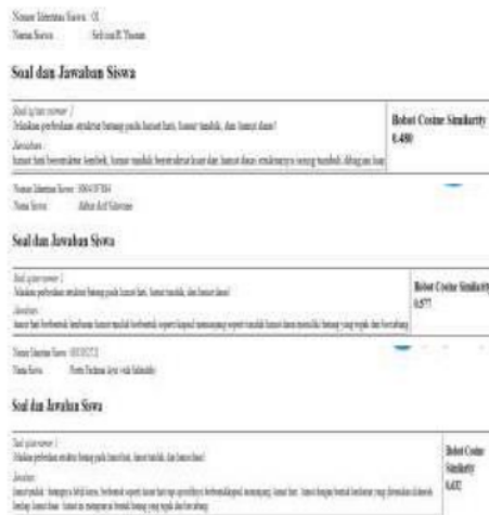
Gambar 6. Output perhitungan aplikasi

Output perhitungan dari aplikasi ditunjukkan pada Gambar 6.