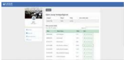
Gambar 4. Form monitoring nilai siswa

Langkah selanjutnya, guru dapat melakukan koreksi jawaban yang diberikan oleh siswa menggunakan metode cosine similarity dengan cara masuk ke dalam form monitoring nilai siswa seperti yang ditunjukkan pada Gambar 4