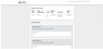
Gambar 3. Form input jawaban siswa

Langkah selanjutnya, guru dapat melakukan koreksi jawaban yang diberikan oleh siswa menggunakan metode cosine similarity dengan cara masuk ke dalam form monitoring nilai siswa seperti yang ditunjukkan pada Gambar 4