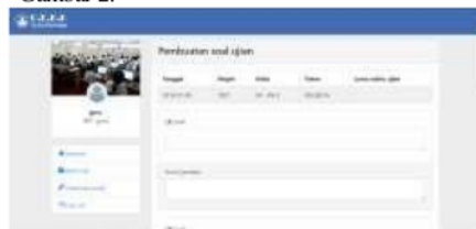
Gambar 2. Form input soal dan kunci jawaban

Pada aplikasi yang dibuat terdapat form yang digunakan oleh guru untuk memasukkan soal dan kunci jawaban seperti yang ditunjukkan pada Gambar 2.