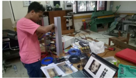
Gambar 7. Perakitan inverter