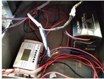
Gambar 4. Pengecekan inverter yang telah terpasang sebelumnya

Pemeriksaan per panel dilakukan untuk menghindari kesalahan akibat adanya panel surya yang sudah aus.