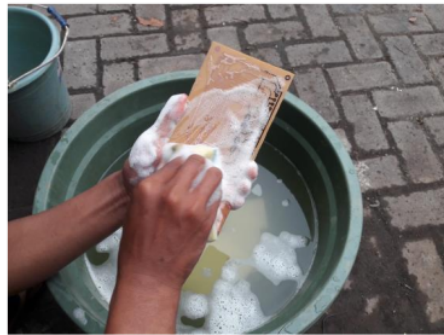
Gambar 5. Pembuatan PCB Inverter

Pembuatan inverter pure sine wave dimulai dengan proses pembuatan papan PCB yang ditunjukkan pada Gambar 5, kemudian dilanjutkan dengan pemasangan komponen dan menguji inverter per sistem untuk menganalisa apakah sistem normal dan tidak mengalami kegagalan yang ditunjukkan pada Gambar 6. Gambar 7 dan 8 menunjukkan perakitan inverter kedalam casing dan dilakukan pengujian sebelum dilakukan instalasi pada Gambar 9.