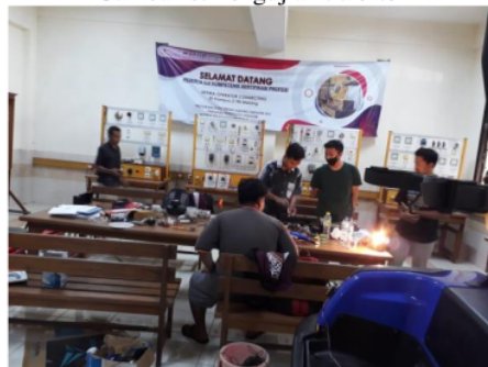
Gambar 9. Pemasangan inverter

Uji coba dilakukan dengan memberikan beban berupa, beban pompa air 250 Watt dan lampu rumah kaca 1200 Watt, dan hasilnya kedua jenis beban tersebut dapat bekerja dengan baik.