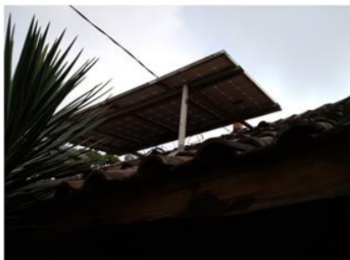
Gambar 3. Pemeriksaan panel surya

Gambar 3 menunjukkan panel surya yang terpasang pada instalasi sebelumnya, dibutuhkan pemeriksaan kembali apakah panel surya masih dapat bekerja dengan baik, pemeriksaan meliputi pengukuran tegangan open circuit dan arus short circuit .