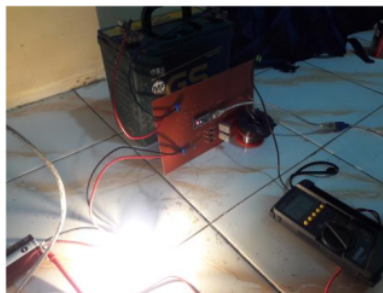
Gambar 6. Pemasangan komponen dan pengujian inverter