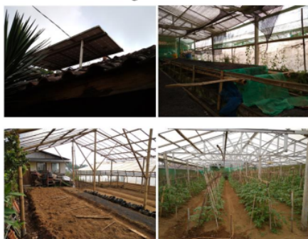
Gambar 2. Pemeriksaan instalasi listrik rumah kaca, lampu dan panel surya pada sistem PLTS