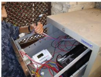
Gambar 1. Pengecekan baterai PLTS

Kegiatan abdimas ini dimulai dengan koordinasi beserta mahasiswa dan anggota abdimas untuk menentukan jadwal kunjungan kepada Mitra abdimas. Setelah koordinasi dilaksanakan, maka kunjungan berikutnya untuk melakukan pemeriksaan teknis dari sistem PLTS yang telah terpasang sebelumnya. Dimulai dengan pemeriksaan kondisi baterai menggunakan AVO meter dengan melihat tegangan baterai apakah normal atau tidak yang ditunjukkan pada Gambar 1. Selain baterai, panel surya beserta instalasi kelistrikan rumah kaca diperiksa kembali, apakah ada keausan baik dari sambungan maupun isolasi kabel instalasi, dan beban, pemeriksaan berkaitan dengan keamanan instalasi kelistrikan untuk mengurangi faktor kegagalan yang ditunjukkan pada Gambar 2.