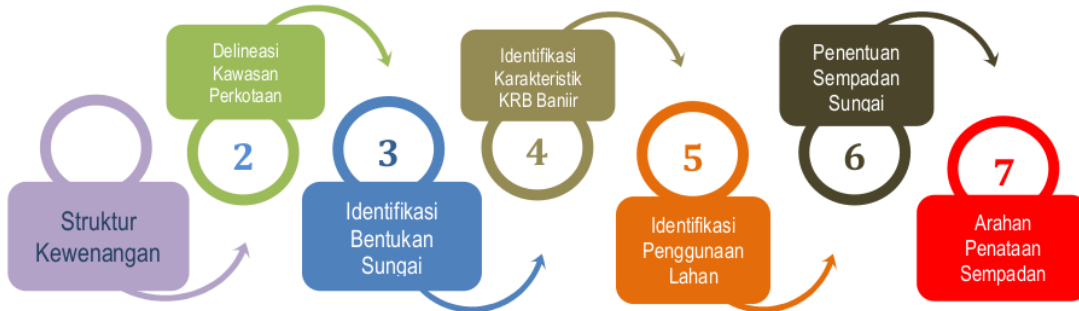
Gambar 1. Kerangka Kerja/Literatur