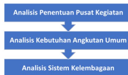
Gambar 1 Proses Perumusan Rute Angkutan Umum

Penjabaran terhadap metode-metode analisis yang akan digunakan dalam proses kegiatan studi ini dilakukan guna menjadi acuan dalam proses pengerjaan kedepannya khususnya dalam proses analisis dalam penentuan kawasan perkotaan dan konsep pengembangan sistem transportasi pada kawasan perkotaan yang telah ditentukan. Beberapa metode analisis ini diperoleh dari studi-studi terdahulu yang relevan terhadap kegiatan studi ini: