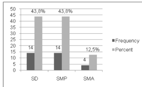
Gambar 4. Grafik Pendidikan Responden