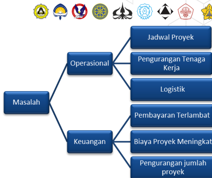
Gambar 1. Ringkasan masalah yang dihadapi proyek konstruksi akibat Pandemi COVID-19.